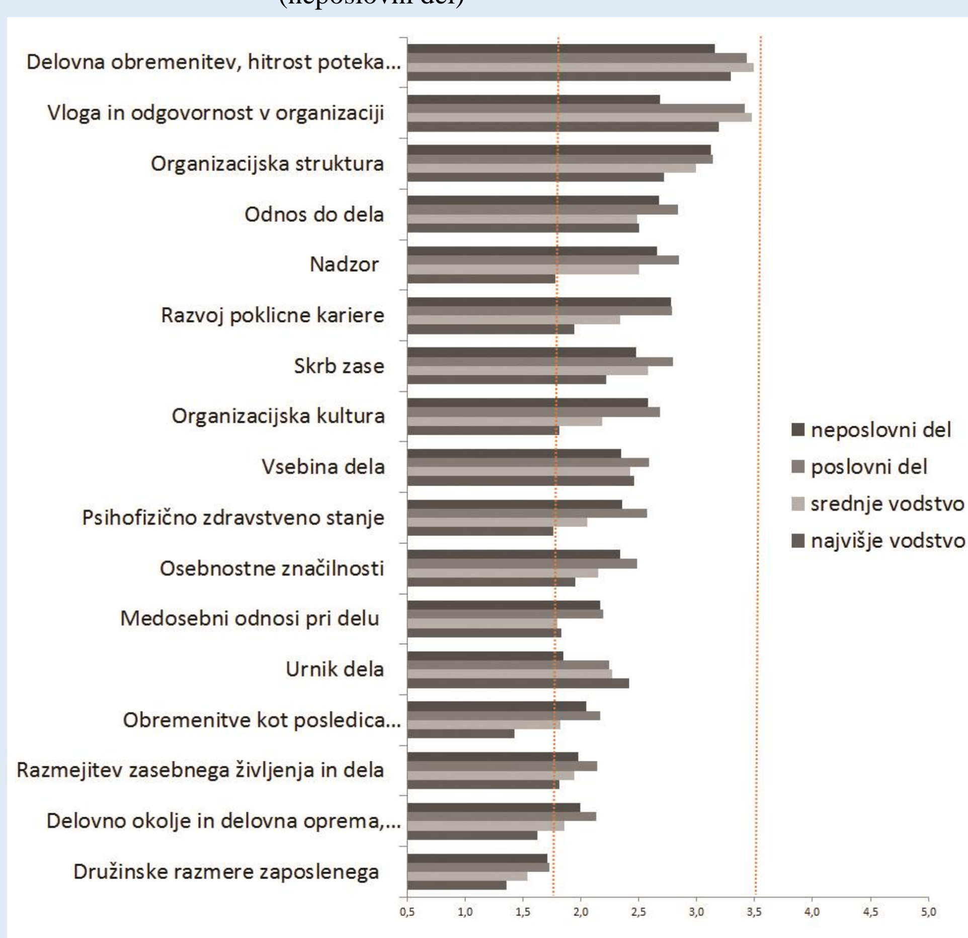
Graf 1. OPSA profil obremenitev po poklicnih skupinah